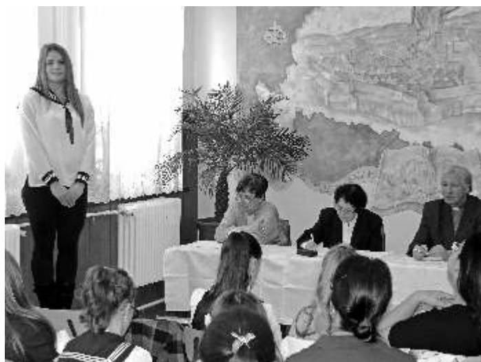
VERS - ÉS PRÓZAMONDÓ VERSENY