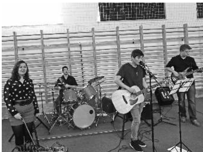
NÁLUNK JÁRT AZ ALTERNATÍVA